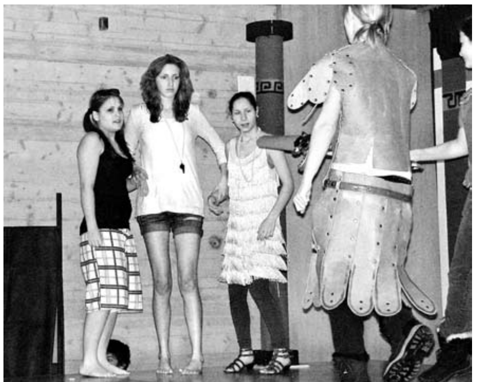
Die Prätorianer wirken auf den ersten Blick angsteinflössend, teilen dann aber gerne ihr Znüni.