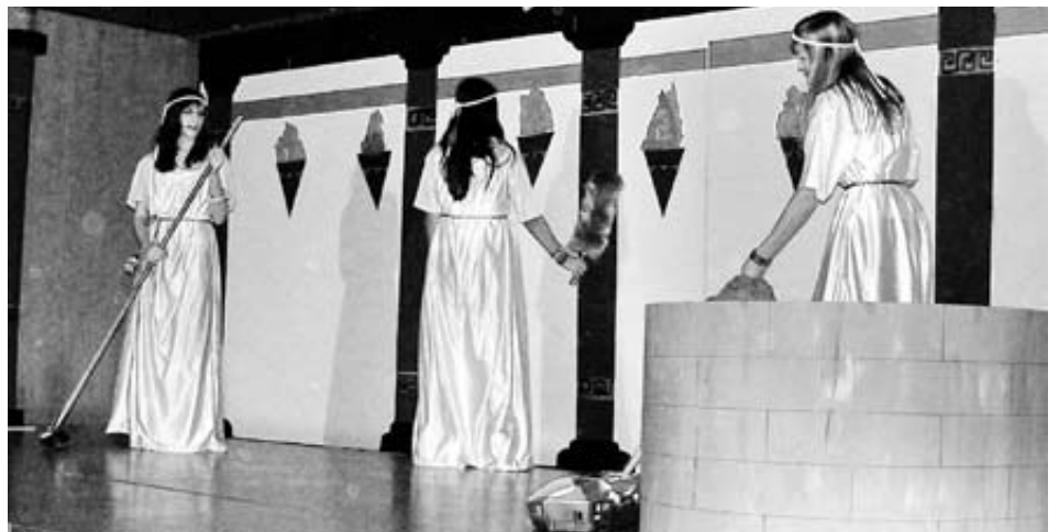
Die unterirdisch-römischen Putzfrauen entpuppen sich als gute Feen.