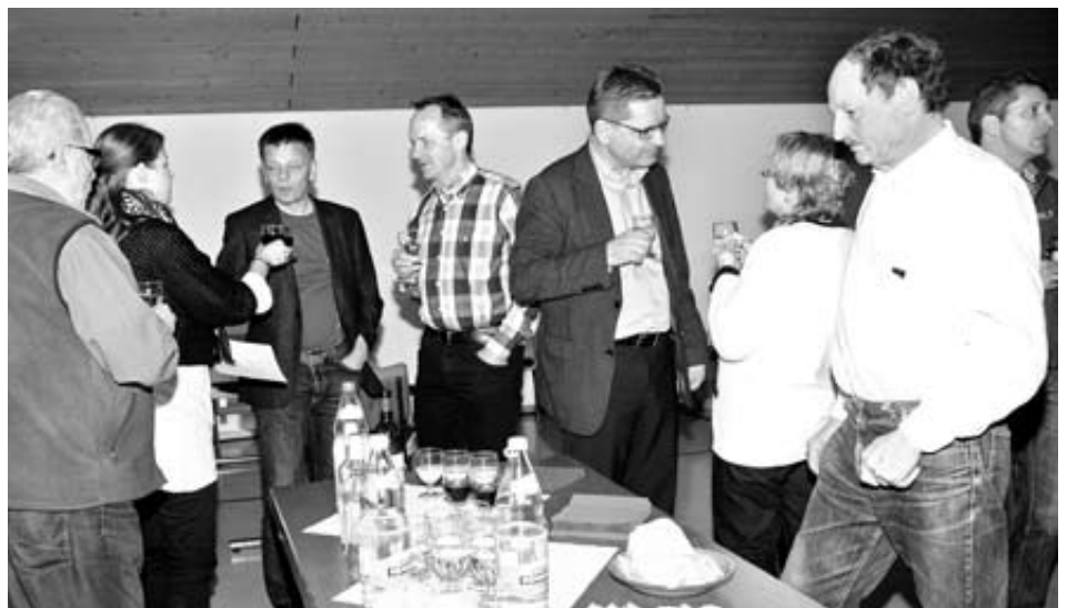
Endinger und Unterendinger beschliessen den Auftakt zu den Abklärungen eines allfälligen Zusammenschlusses mit einem gemeinsamen Apéro.

Die Auftaktsitzung diente der Formierung von fünf Arbeitsgruppen, in denen Vertreter der Gemeindebehörden, Verwaltung, Vereine und Dorfbevölkerung in unterschiedlicher Zusammensetzung bis Ende dieses Jahres Entscheidungsgrundlagen in den zentralen Bereichen der Gemeinwesen und des Dorflebens erarbeiten. Die Arbeitsgruppen vertiefen sich in die Gebiete «Ortsbürger/Forst», «Finanzen/Hauensteinfonds», «Dienstleistungen/Personal», «Gemeindewerk/Infrastruktur/Liegenschaften» und «Gesellschaft/Vereine». Die Arbeit der Gruppen ist ergebnisoffen angelegt: Einerseits sollen die Chancen eines Zusammenschlusses in Bezug auf die sich ändernde Gemeinde-landschaft des Kantons und Bedürfnisse der Bevölkerung herausgeschält werden. Andererseits sollen aber auch Risiken und Stolpersteine angesprochen und allfällige Lösungsansätze entworfen werden. Ein Schlussbericht bündelt die Erkenntnisse und bildet die Entscheidungsgrundlage für die beiden Gemeinderäte, auf Basis derer im ersten Quartal 2012 die Anträge für das weitere Vorgehen zuhanden der Sommergemeindeversammlungen entwickelt werden können. (pk)