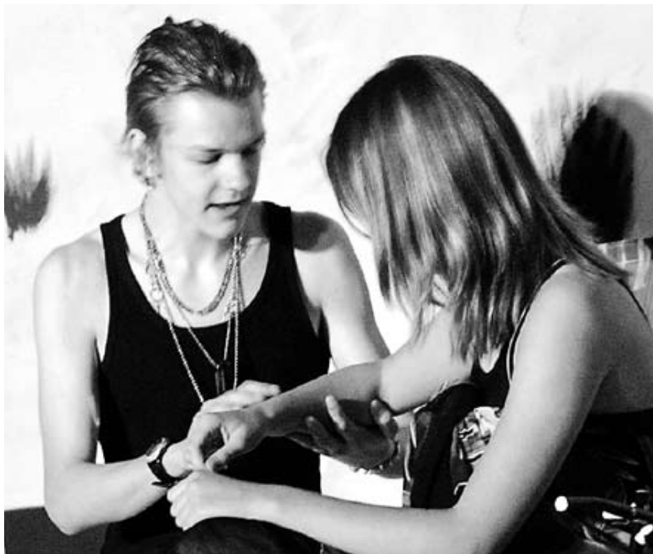
Luigi bewundert den wie aus Marmor gedrechselten Arm der Touristin.

Immer einen Schritt hintennach, trifft die Suchmannschaft auf eine Prätorianergarde und kreuzt schliesslich das Putzfrauentrio, das ihnen den Weg weist. Ein Running Gag sind die von der Decke hängenden Maulwürfe, die andeuten, dass die Szene unterirdisch spielt. Derweil entführt Suphus den kleinen Tobi in die Unterwelt, zur erstarrten Frau des Lots. Dort soll er als lang gesuchte Opfergabe dem Ehrgeizling Suphus die römische Weltmacht zurückgeben. Nach und nach treffen alle Figuren in der Unterwelt ein, die Ereignisse überstürzen sich. Zuletzt besingt der Chor der unglücklich Vereinten in einem Song, komponiert von einer Schülerin der 4c, das traurige Schicksal der jungen Bademeisterin, die Model werden wollte und die den Hungertod erleidet.