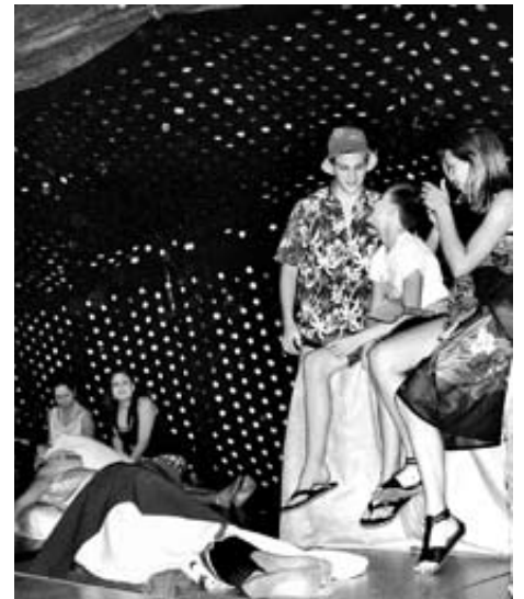
Wiedersehen zwischen Eltern und vermisstem Sohn: «Freude herrscht».

«Schade, dass ich wieder ganz normal sein muss», fasste der hyperaktive Sohn seine Erfahrungen aus dem Theater zusammen, wohl stellvertretend für alle.